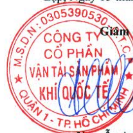
Đỗ Đức Hùng